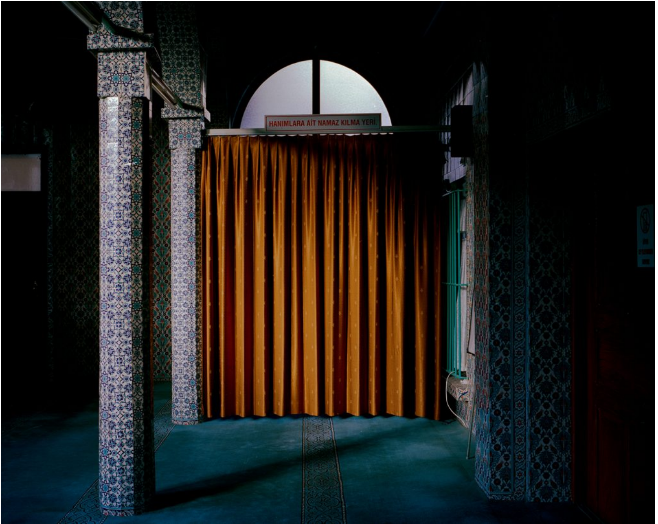
© Öncü Hrant Gültekin „Pavogtos Armėnijos kapinės“

Mykolo Žilinsko dailės galerijos trečiame aukšte KAUNAS PHOTO festivalis pristatys parodą skirtą pasaulio lietuvių fotografijai „Šeinius + Scheynius“. Pirmąkart bus rodomos Igno Šeinius kurtos fotografijos, atskleidžiančios dar nežinomą Lietuvos diplomato, žurnalisto ir rašytojo asmenybės pusę. Šalia šių fotografijų nuguls jo proanūkės, žymios menininkės Lina Scheynius (Švedija) darbai, kurie nebyliai polemizuos su prosenelio atostogų fotografija.