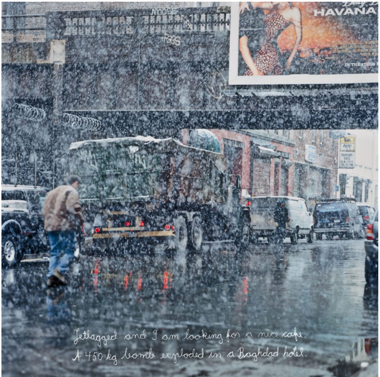
"My Weather Diary"