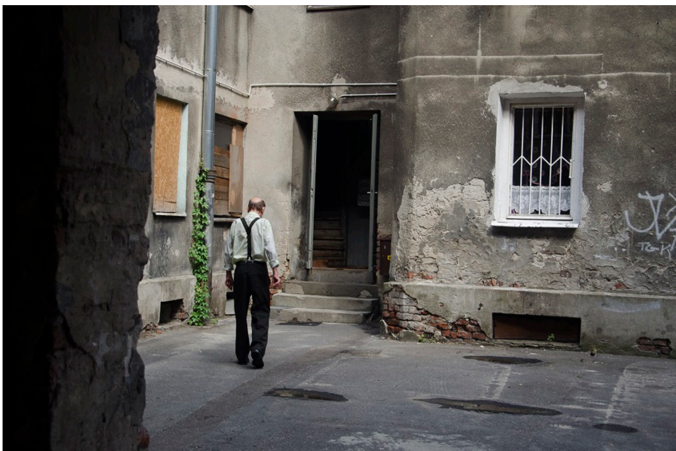
On the Threshold