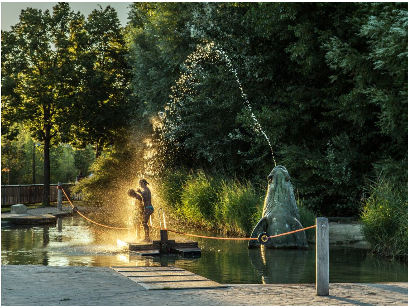
"Danube – The Blue River"