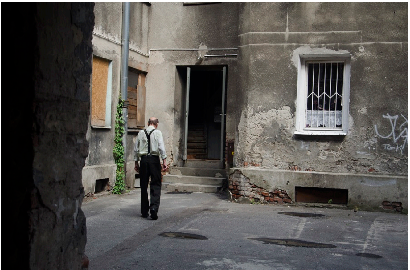
On the Threshold